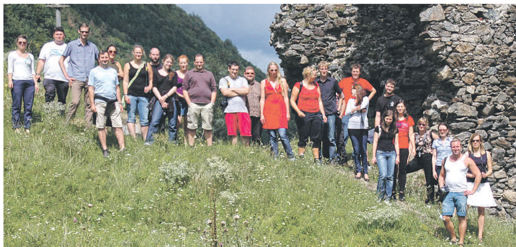
Die Teilnehmer der 28. Akademiewoche vor dem „Zerbrochener Turm“ während einer Exkursion zum Roten-Turm-Pass im Alttal.